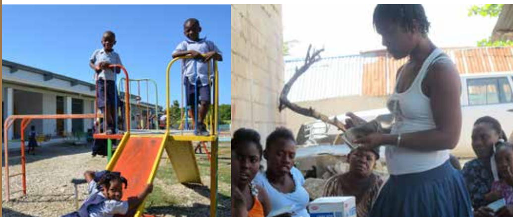
> Schulbau-Projekt in Léogâne, Haïti Le projet de l'école à Léogâne, Haïti

Organisation partenaire: World Relief Malawi Région: Chilooko et Malenga, district Ntschisi But du projet: les écoles maternelles préparent les enfants à l'école primaire publique et leur proposent des repas chauds. Les garderies sont équipées de matériel d'appren-