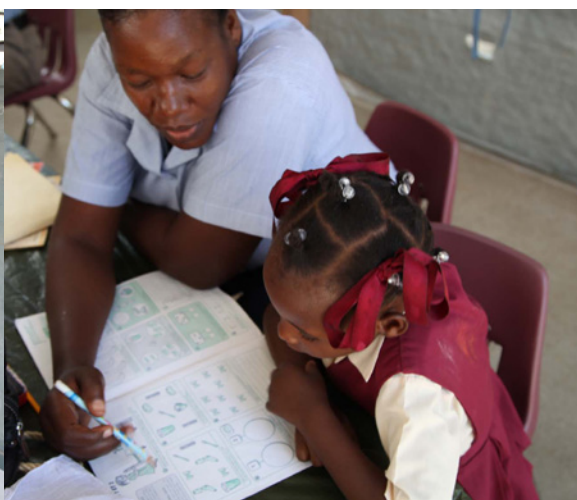
< Projekt Schulbau Léogâne, Haiti Le projet de l'école à Léogâne, Haïti